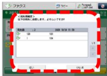
⑤ 同報確認ポップアップ