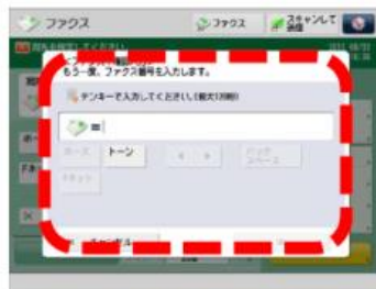
② ファクス番号入力時の確認入力