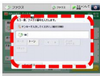
② ファクス番号入力時の確認入力