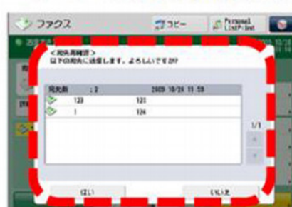
⑤ 同報確認ポップアップ