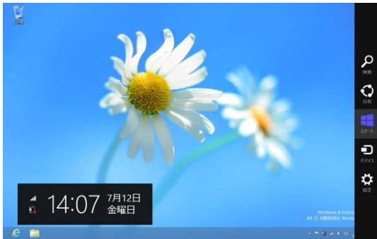
チャームの表示「Windowsキー + C」。チャームと同時に日付と時刻も表示される