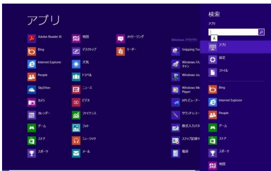
「Windowsキー + Q」でアプリの検索、およびアプリの一覧ができる