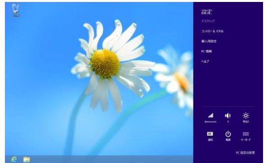
「Windowsキー + I」で、設定チャームが開く。